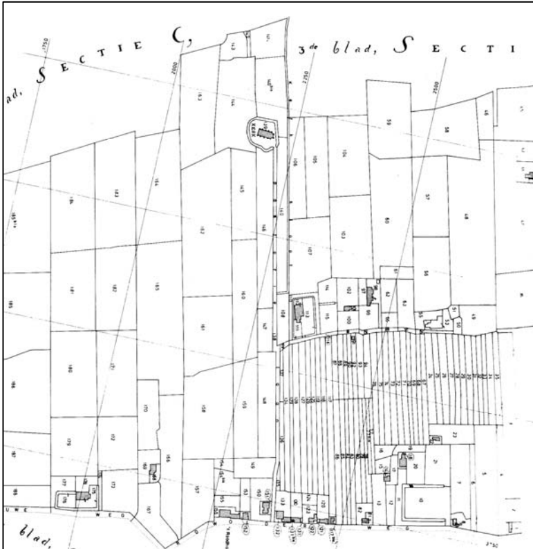
Kadastrale Atlas Drenthe, 1832, Gemeente Roden, sectie C

We zitten hier in het hart van het oude Roderwolde, op het kruispunt van de Roderwolderdijk, de doorgaande weg van Groningen naar Roden, de weg naar de oude Jacobskerk in het noorden en van een pad dat naar het westen leidde. Dit laatste pad liep in vroeger eeuwen vanaf dit kruispunt ten zuiden van de pastorie langs een aantal boerderijen tot aan de Kruiskamp. In de huidige situatie te vergelijken met een