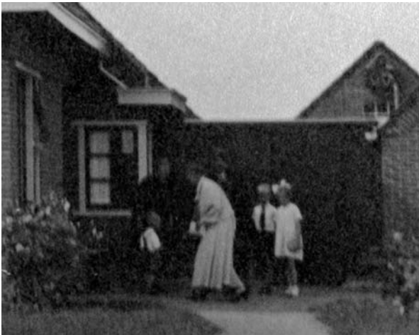
Waarschijnlijk Evert en Reina Liewes met Tennis en Hantje. Kennelijk is er bezoek van een mevrouw met een jongetje met een keurige stropdas. Mogelijk heeft Tieme Staal de foto genomen met zijn vrouw en zoon erop. Deze foto is kort na de nieuwbouw gemaakt.