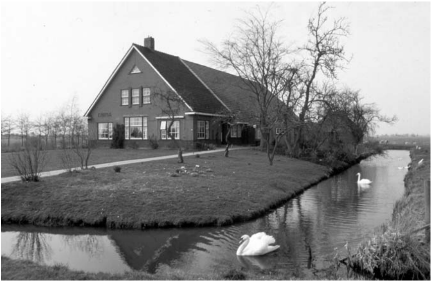
De Enumaboewe in de tijd dat de fam. Van der Veen hier woonde.