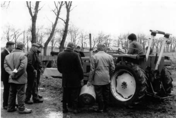
Kijkers op de boeldag bij Jan Eeuwema in 1987.

Jan Eeuwema overleed in 1986. Bij gebrek aan opvolging besloot de familie Staal de boerderij en de landerijen te verkopen. In 1987 werd boeldag gehouden, waar, even als in 1831, een grote schare lokale boeren, burgers en buitenlui op af kwam. Het huis werd in 1988 verkocht aan Albert van der Veen en Grietje Huizing die hun bedrijf Van der Veen Service hier onderbrachten. De zaak bleef tot 2009 in de Enumahoeve gevestigd. Het huis zal in de toekomst als woonboerderij in gebruik worden genomen.