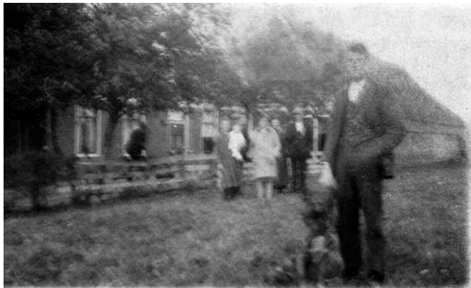
De enige bekende foto van de oude boerderij, met leden van de familie Rozema.