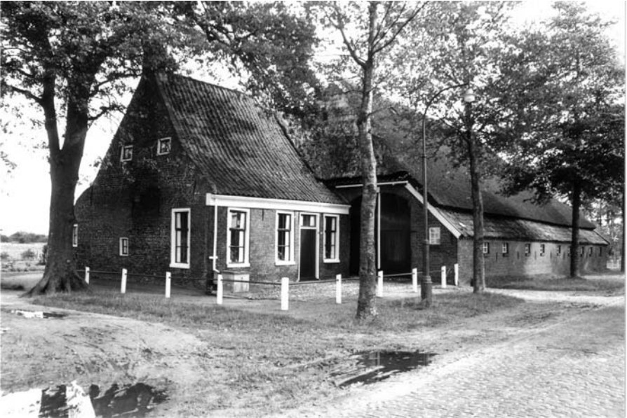
Boerderij Veurman aan de Zuurseweg no. 23 te Peize.