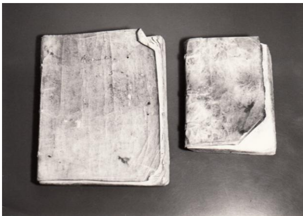
Links Boek II over de jaren 1608-1637, rechts Boek I van 1538-1608.

In het Drents Archief in Assen vinden we onder inventarisnummer 374 van het Oude Staten Archief de volgende omschrijving: Aantekeningboeken omtrent de administratie der kerkvoogdij van Roderwolde . In de omslag zitten twee kleine met de hand ingeschreven boekjes, gedeeltelijk in perkament gebonden