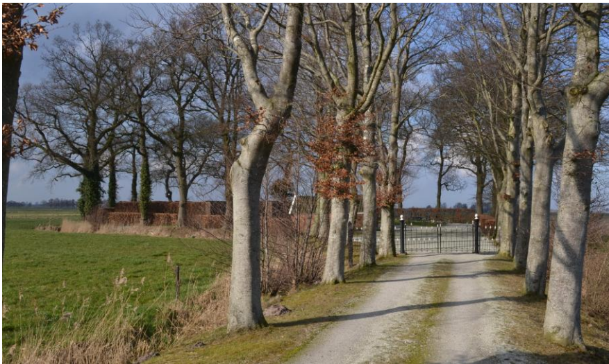
De oude St. Jacobskerk stond in oost-west richting midden op de huidige begraafplaats.

Door de vondst van deze twee zeer oude aantekenboekjes kan ook het tweede misverstand definitief uit de weg geruimd worden: er is gelukkig wel degelijk het een en ander bekend over deze interessante periode in de kerkgeschiedenis van Roderwolde.