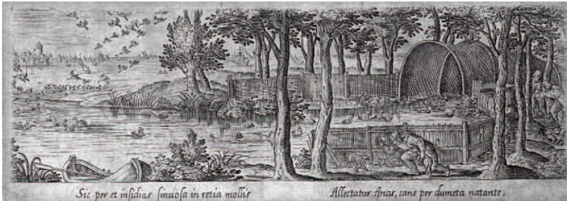
Gravure van een eendekooi uit de 17 e eeuw.

water' of 'wat vliegt er 'n vogel' en dan vlogen er eenden rond. 4 Al vroeg ging men er toe over aan de oevers van plas en vaart permanente vangpijpen te plaatsen waarin de eenden gelokt werden. Tot in de zeventiende eeuw werd dit toegepast in de Wijk, waar de Wetering als kooiplas fungeerde. 5 Het nadeel van deze methode was dat de eenden er niet in werden gedreven, maar gelokt. Het rendement was betrekkelijk gering. Een grote verbetering was het later algemeen toegepaste systeem sloten en kleine poelen te gebruiken of een vijver te graven en daarop aansluitend enige vangpijpen aan te leggen.