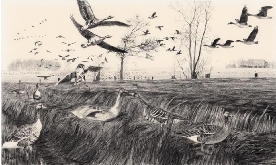
Ganzen langs de Hooiweg in Roderwolde op Kooihoogte. (tekening Dina Belga 1989)