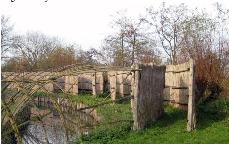
Moderne eendenkooi met rietmatten.